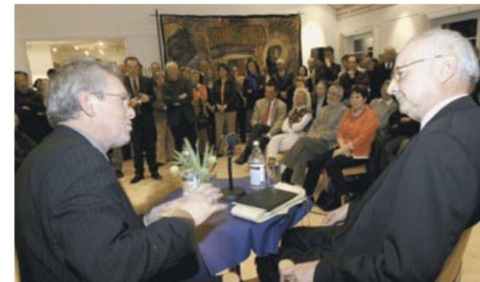
Feierstunde zum 5. Geburtstag des Ökumenischen Bildungszentrums sancti clara Mannheim Ist Glaube Privatsache jedes Einzelnen? Was heißt Gott lieben? Oder warum sollen Menschen überhaupt glauben? Ohne vorherige Absprachen versuchen sich Erzbischof Zollitsch und Landesbischof Fischer diesen Themen im Dialog zu nähern, was die Anwesenden gebannt verfolgten.

Neben der Beschreibung der Leitbegriffe – Berufung, Sammlung und Sendung – wird es deshalb wichtig sein, Aufbruch als ein pastorales Handlungsprinzip zu konkretisieren. Wo begeben wir uns hin, in meinem alltäglichen pastoralen Weg? Wen treffe ich an, wenn ich unterwegs bin? Die Pastoralen Leitlinien sollten ermutigen, solche Fragen zu stellen und zugleich die Richtung für ein zukunftsfähiges pastorales Wirken der Kirche angeben. Vor allem aber sollten sie Mut machen, in aller Öffentlichkeit die christliche Hoffnungsbotschaft zu vertreten und erfahrbar werden zu lassen, was sie für die Menschen in ihrer konkreten Lebenssituation bedeutet.