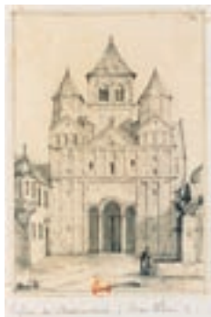
L' Eglise de Marmoutier

Vom 13.–15. Oktober 2006 der Renner im Bildungswerk: das Wochenende für unsere Ehrenamtlichen (mit Ehepartner) im Elsass – jeweils an ausgesuchten Orten, diesmal bei