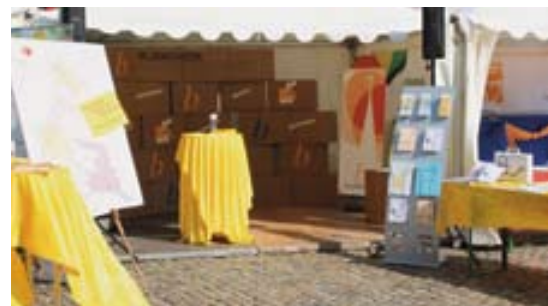
Der Stand des Bildungswerks beim Diözesantag 2010 in Freiburg