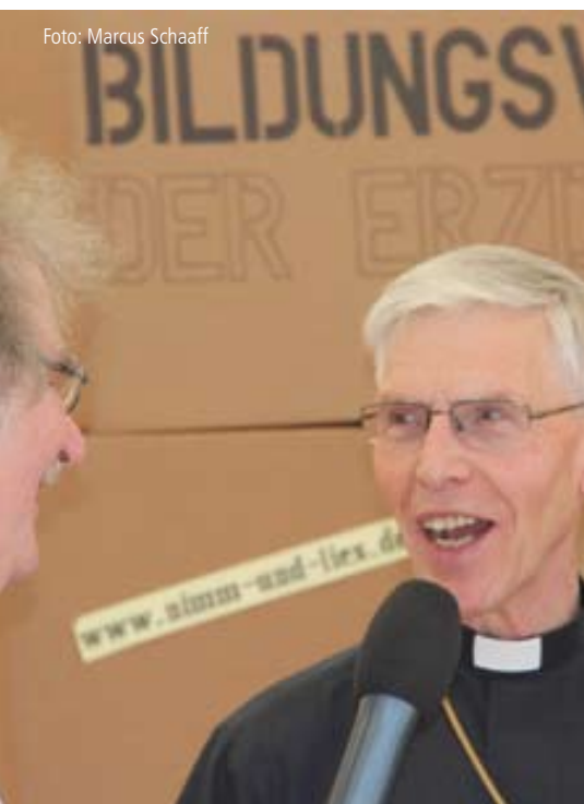
Weihbischof Paul Wehrle am Stand des Bildungswerks während des Diözesantags 2010